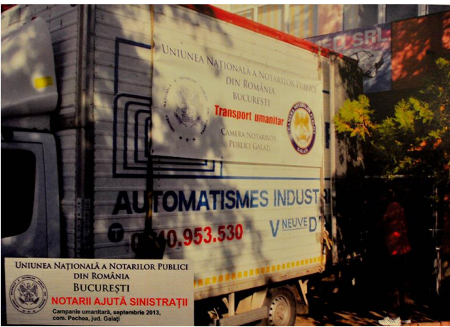
UNIUNEA NAȚIONALĂ A NOTARIILOR PUBLICI DIN ROMÂNIA BUCUREȘTI NOTARIII AJUTĂ SINISTRAȚII Campanie umanitară, septembrie 2013, com. Pechea, jud. Galați