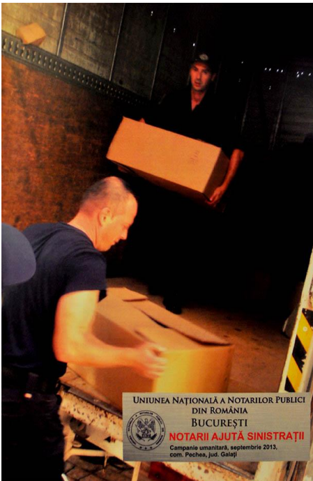
UNIUNEA NAȚIONALĂ A NOTARIILOR PUBLICI DIN ROMÂNIA BUCUREȘTI NOTARIII AJUTĂ SINISTRAȚII Campanie umanitară, septembrie 2013, com. Pechea, jud. Galați