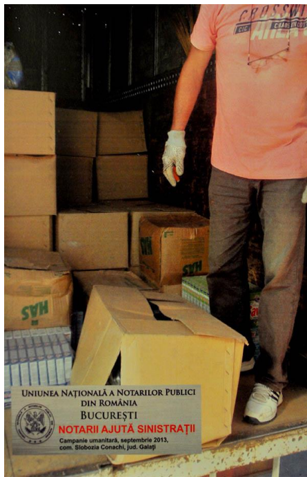
UNIUNEA NAȚIONALĂ A NOTARIILOR PUBLICI DIN ROMÂNIA BUCUREȘTI NOTARIII AJUTĂ SINISTRAȚII Campanie umanitară, septembrie 2013, com. Slobozia Conachi, jud. Galați