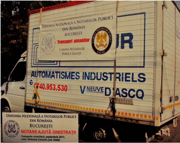
UNIUNEA NAȚIONALĂ A NOTARIILOR PUBLICI DIN ROMÂNIA BUCUREȘTI NOTARIII AJUTĂ SINISTRAȚII Campanie umanitară, septembrie 2013, com. Slobozia Conachi, jud. Galați