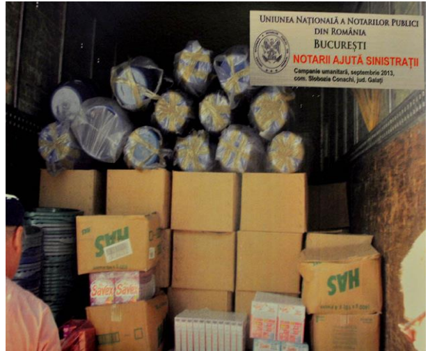
UNIUNEA NAȚIONALĂ A NOTARIILOR PUBLICI DIN ROMÂNIA BUCUREȘTI NOTARIII AJUTĂ SINISTRAȚII Campanie umanitară, septembrie 2013, com. Slobozia Conachi, jud. Galați