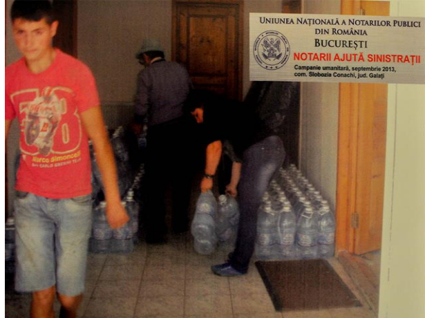
UNIUNEA NAȚIONALĂ A NOTARIILOR PUBLICI DIN ROMÂNIA BUCUREȘTI NOTARIII AJUTĂ SINISTRAȚII Campanie umanitară, septembrie 2013, com. Slobozia Conachi, jud. Galați